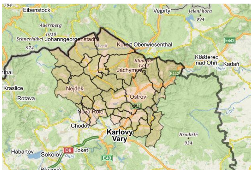
Obrázek 1 Území působnosti MAS Krušné hory s vyznačením hranic obcí