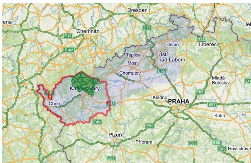
Obrázek 2 Území působnosti MAS Krušné hory v kontextu regionů NUTS2 a NUTS3