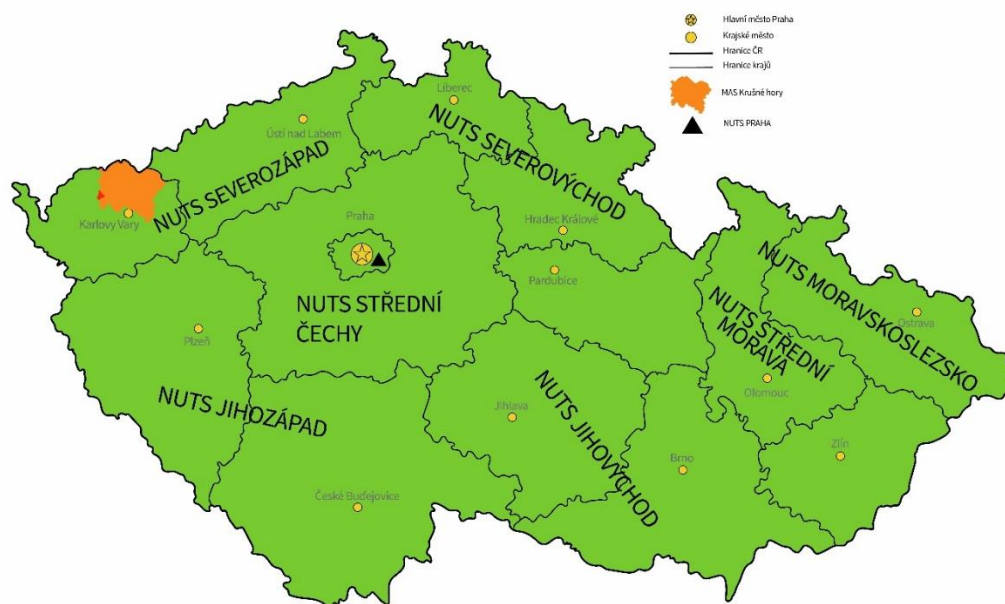
Obrázek 2 Území působnosti MAS Krušné hory v kontextu regionů NUTS2 a NUTS3