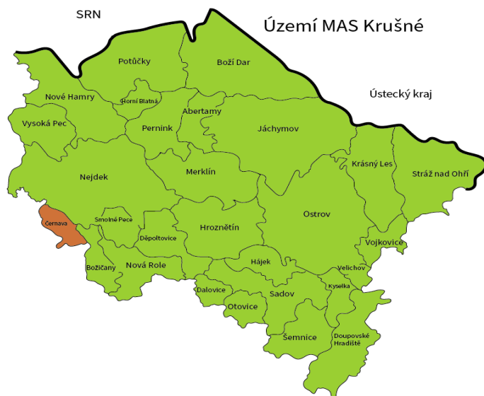
Obrázek 1 Území působnosti MAS Krušné hory s vyznačením hranic obcí